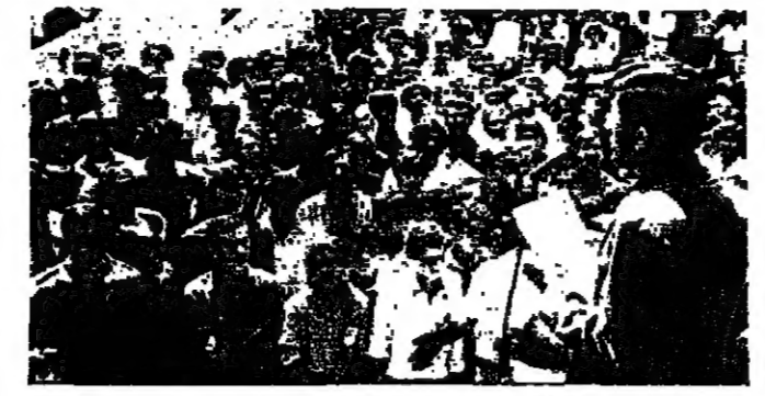
احد الخطباء يلقى كلمة في مهرجان المنظمات الشعبية بجامعة دمشق

تمريض لخدام - تنمة دمشق : وسئل الوزير خدام عن احتمال عقد اجناع في المستقبل بين الرئيس حافظ الابد وكينسجر وزير الخارجية الفرنسي ، فاجاب : ان جميع الخلق مسدودة وفي السيد خدام وجود استعدادات حالية لعقد اجناع بين الرئيسين السيد خدام والسيد كينسجر ، ان هذا الموضوع لم يرد في الوقت الحاضر ، وفي ايها ان يكون قد بحث مع المسؤولين الكوريين مسألة عقد مؤتمر قمة عربي ، وواضح ان سوريا تود عقد اجناع قمة يكون هدفه منع استسماج جبهة المراهقة مع العدو .